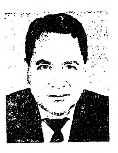
كان يتحدث عن التدين» شمسوب

غير الجيوش والحرب وازارة النما . . فقد نعت ذلك في الدرجة الاولى ، بنظامها الاقتصادي الراسمالي العالمي ، الذي تقيد به الى بلدان العالم الثالث ، باسم « مسانعة على التطوير » ، مستغلة به شعار الدول الاستعمارية القديمة ، الذي